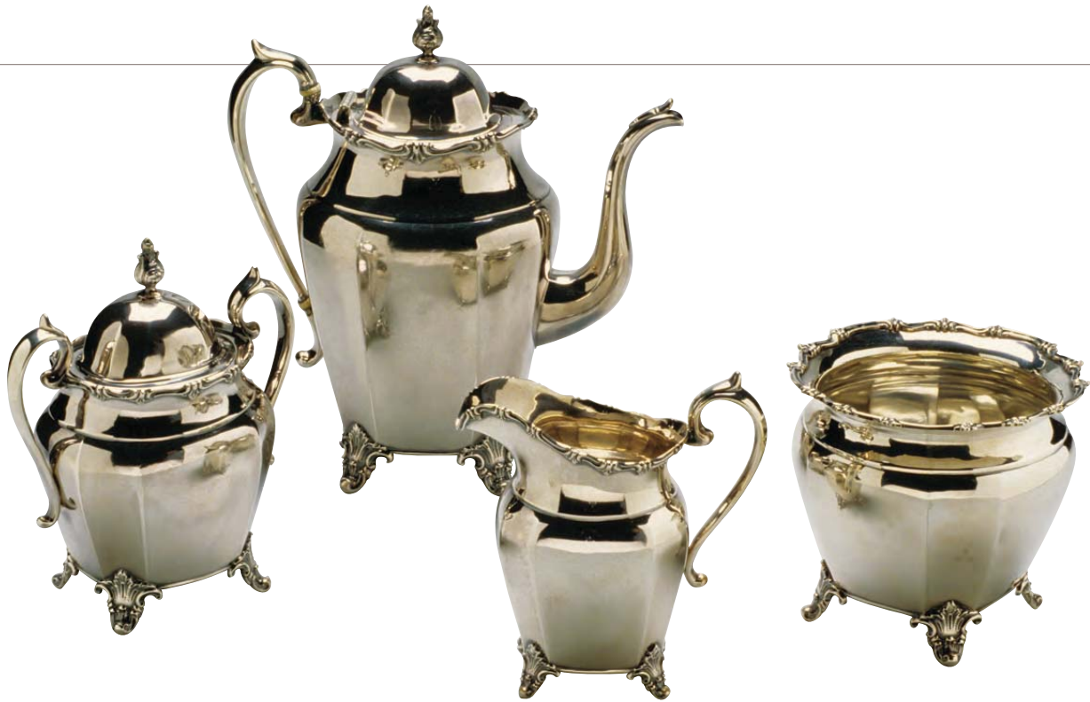
2-B.2 Thomas William Brown (Wilmington, Carolina del Norte), juego de té. Plata, c. 1840–1850.

un hilo de encaje, se extiende en líneas ondulantes en la parte superior e inferior de la tetera. La ligereza de este diseño agrega gracia a la tetera sin restarle fuerza.