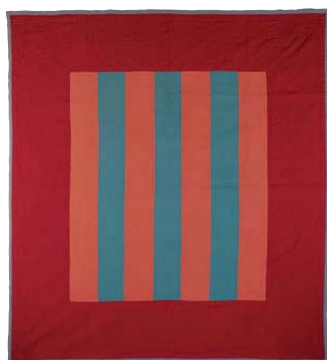
10-B.3 Colcha de barras, c. 1920. Cubierta de lana, forro de algodón gris azulado. Dimensiones totales 72 x 80 pulgadas (182.9 x 203.2 cm). Donación de "The Great Women of Lancaster". Colección Heritage Center of Lancaster County, Lancaster, Pa.