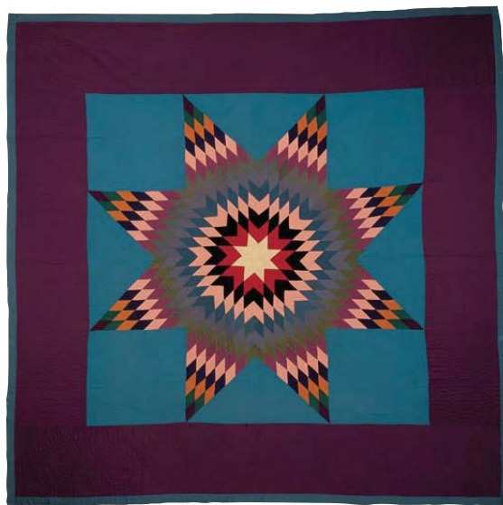
10-B.8 Colcha de rombo y cuadrado, variación Luz y sombra, c. 1935. Cubierto de lana, forro de sarga de algodón violeta. Dimensiones totales 80 x 80 pulgadas (203.2 x 203.2 cm). Donación de "The Great Women of Lancaster." Colección Heritage Center of Lancaster County, Lancaster, Pa.