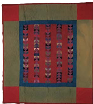
10-B.7 Colcha de barras (diseño Wild Goose Chase) c. 1920. Cubierto de lana, forro de algodón floreado morado y blanco. Dimensiones totales 72.5 x 79.5 pulgadas (184.2 x 201.9 cm). Donación de Irene N. Walsh. Colección Heritage Center of Lancaster County, Lancaster, Pa.