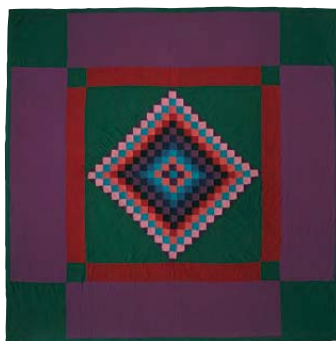
10-B.6 Colcha de estrella solitaria, c. 1920. Cubierto de lana; forro de algodón cuadrículado rojo, verde y blanco. Dimensiones totales 89 x 89 pulgadas (193 x 193 cm). Donación de Irene N. Walsh. Colección Heritage Center of Lancaster County, Lancaster, Pa.

La textura de muchas de las colchas está realizada con puntadas que trazan rombos, plumas, guirnaldas, parras y flores, agregando dimensiones de complejidad visual a la pieza. Aunque se cree que las colchas más antiguas son obras individuales de las mujeres amish del condado de Lancaster, en tiempos más recientes, las mujeres se han agrupado para confeccionar colchas en reuniones comunitarias llamadas quilting bees o frolics .