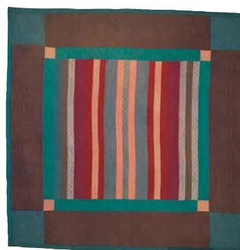
10-B.5 Colcha de barras asimétricas, c. 1935. Cubierta de lana; forro, sarga estampada blanca y negra de algodón. Dimensiones totales 76 x 76 pulgadas (193 x 193 cm). Colección Heritage Center of Lancaster County, Lancaster, Pa.