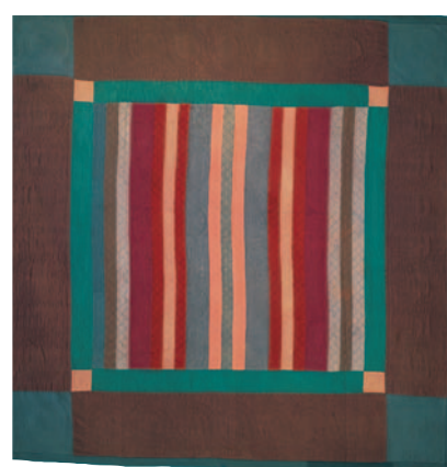
10-B.5 Quilt à bandes alternées (Split Bars Pattern Quilt) , vers 1935. Dessus : laine tissée unie et crêpe ; dessous : coton tissé uni noir et blanc imprimé sergé. Dimensions globales : 193 x 193 cm. Collections du Heritage Center of Lancaster County, Lancaster, en Pennsylvanie.