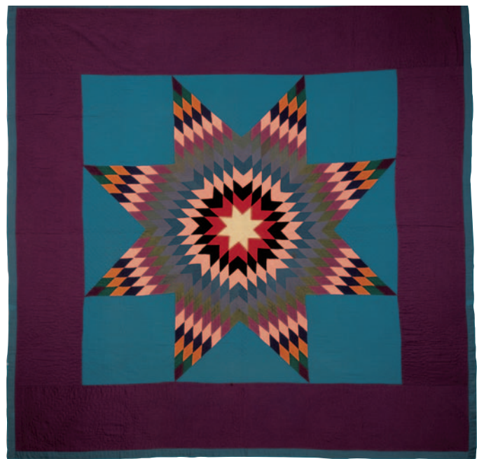
10-B.6 Quilt à une seule étoile ( Lone Star Pattern Quilt ), vers 1920. Dessus : laine tissée unie ; dessous : coton écossais et coton tissé uni avec des motifs imprimés rouges, verts et blancs. Dimensions globales ; 193 x 193 cm. Don d'Irene N. Walsh. Collections du Heritage Center of Lancaster County, Lancaster, en Pennsylvanie.