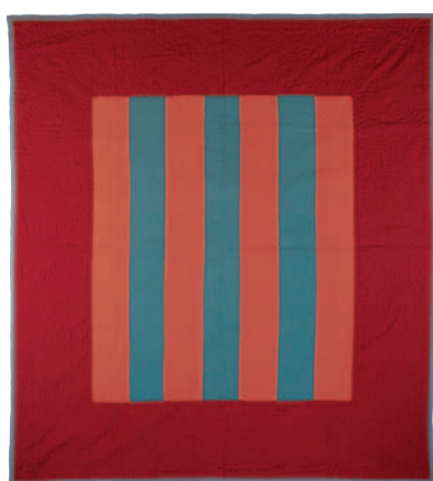
10-B.3 Quilt à bandes (Bars Pattern Quilt) , vers 1920. Dessus : laine tissée unie ; dessous : coton tissé uni gris et bleu. Dimensions globales : 182,9 x 203,2 cm. Don de « The Great Women of Lancaster ». Collections du Heritage Center of Lancaster County, Lancaster, en Pennsylvanie.