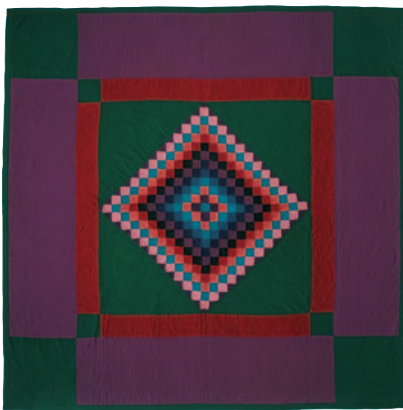
10-B.8 Quilt avec diamant à l'intérieur d'un carré ( Diamond in the Square—Sunshine and Shadow Variation Pattern Quilt ), c. 1935. Dessus : laine pourpre tissée unie et sergée ; dessous : coton pourpre tissé sergé. Dimensions hors tout 203,2 x 203,2 cm. Don de « The Great Women of Lancaster ». Collections of the Heritage Center of Lancaster County, Lancaster, en Pennsylvanie.

De nombreux quilts sont enrichis par des mailles de formes variées (diamants, plumes, couronnes, vignes et fleurs) qui ajoutent une autre couche de complexité technique et visuelle. Il semble que les quilts les plus anciens tels que ceux qui sont reproduits ici soient le produit d'un travail individuel au sein de la communauté des Amish du comté de Lancaster. Plus récemment, des femmes se sont souvent rassemblées pour produire des quilts incorporant les compétences de chacune à l'occasion de réunions communautaires portant des noms tels que « les reines du quilt » ou « quilts en folie ».