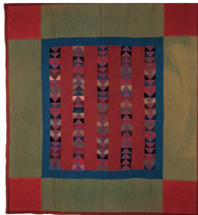
10-B.7 Quilt à bandes ( Wild Goose Chase Pattern Quilt ), c. 1920. Dessus : laine tissée unie et crêpe ; dessous : motifs imprimés (vignes et fleurs blanches), coton tissé uni. Dimensions hors-tout 184,2 x 201,9 cm. Don d'Irene N. Walsh. Collections of the Heritage Center of Lancaster County, Lancaster, Pennsylvanie.