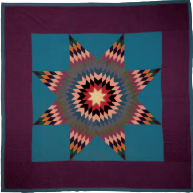
10-ب.6 لحاف زخرفة النجم الوحيد، حوالي عام 1920. الطبقة العليا، صوف نسيج سادة؛ الطبقة الخلفية، قطن نسيج سادة مزخرف بنسيج مربع النقش أحمر وأخضر وأبيض. الأبعاد الكلية 89 × 89 بوصة (193 × 193 سم). إهداء من إيرين إن والش. مجموعات مركز التراث بمقاطعة لانكاستر، بنسلفانيا.

وقد تميزت ملابس الرجال باللون الأسود أو الأزرق الداكن، وبساطة القصة، أما ملابس النساء فكانت ألوانها قوية (مع تجنب الأحمر البراق أو البرتقالي أو الأصفر أو الوردي) وكانت عادة ما تحتوي على نوع من غطاء الرأس.