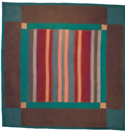
10-ب. 5. لحاف زخرفة الأشرطة المقسومة، حوالي عام 1935. الطبقة العليا، صوف نسيج سادة وكريب؛ الطبقة الخلفية، قطن نسيج سادة ونمط مزخرف تويل أسود وأبيض. الأبعاد الكلية 76 × 76 بوصة (193 × 193 سم). مجموعات مركز التراث بمقاطعة لانكاستر، بنسلفانيا.

يُرجع الأميث أصولهم إلى حركة الأنابابست، التي ظهرت في بدايات القرن السادس عشر في أعقاب الإصلاح البروتستانتي. وقد كان أتباع حركة الأنابابست دعاة سلام يارسون معمودية الكبار بشكل يقتصر