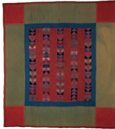
10-ب.7 لحاف زخرفة مطاردة الأوز البري، حوالي عام 1920. الطبقة العليا، صوف نسيج سادة وكريب؛ الطبقة الخلفية، قطن نسيج سادة ونمط مزخرف بالزهور أحمر داكن وأبيض. الأبعاد الكلية 72.5 × 79.5 بوصة (184.2 × 201.9 سم). إهداء من إيرين إن والش. مجموعات مركز التراث بمقاطعة لانكاستر، بنسلفانيا.