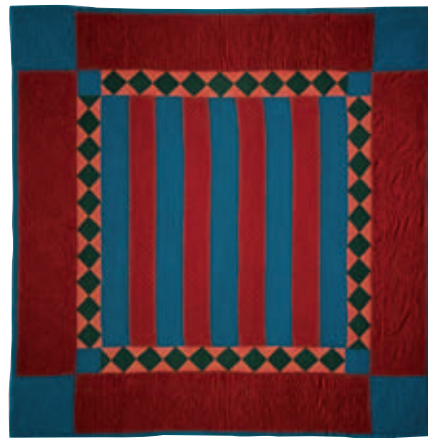
10-ب. 4. لحاف زخرفة الأشرطة، حوالي عام 1925. الطبقة العليا، صوف نسيج سادة؛ الطبقة الخلفية، قطن نسيج سادة بني وأبيض ومزخرف بمربعات. الأبعاد الكلية 77.5 × 77.5 بوصة (196.9 × 196.9 سم). إحياء لذكرى لويزا ستولنزفوس. مجموعات مركز التراث بمقاطعة لانكاستر، بنسلفانيا.