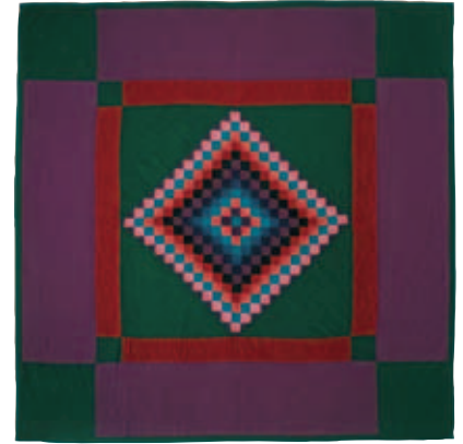
10-ب.8 ماس في المربع - لحاف زخرفة تنوع ضوء الشمس والظل، حوالي عام 1935. الطبقة العليا، صوف سادة ونسيج تويل أرجواني؛ الطبقة الخلفية، قطن نسيج تويل أرجواني. الأبعاد الكلية 80 × 80 بوصة (203.2 × 203.2 سم). هدية من "نساء لانكاستر الرائعات." مجموعات مركز التراث بمقاطعة لانكاستر، بنسلفانيا.