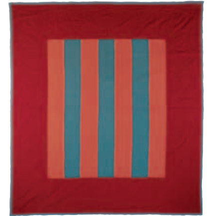
10-ب. 3. لحاف زخرفة الأشرطة، حوالي عام 1920. الطبقة العليا، صوف نسيج سادة؛ الطبقة الخلفية، قطن نسيج سادة رمادي وأزرق. الأبعاد الكلية 72 × 80 بوصة (182.9 × 203.2 سم). هدية من "نساء لانكاستر الرائعات". مجموعات مركز التراث في مقاطعة لانكاستر، بنسلفانيا.